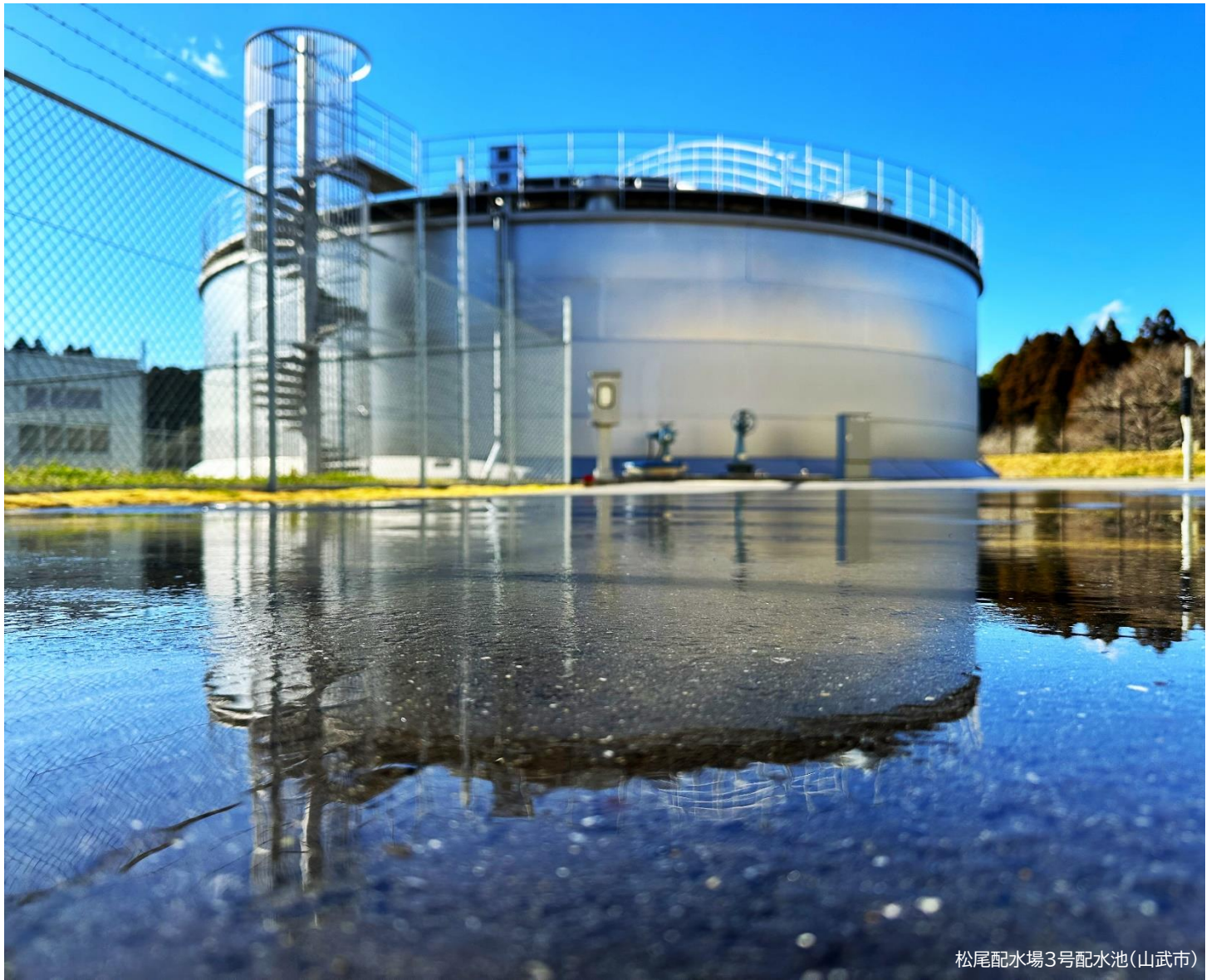
松尾配水場3号配水池(山武市)

山武郡市広域水道企業団 Sanbugunshi Water Supply Authority